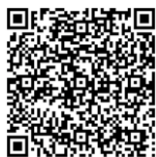
空き家バンク活用促進事業補助金