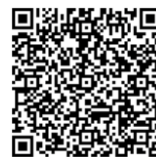
民間宅地開発事業補助金