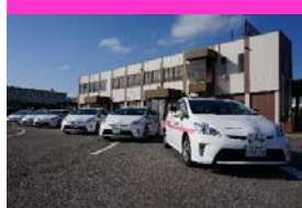
▲AT車は全車プリウス