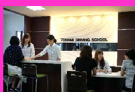
▲快適な待合ロビー&学科教室