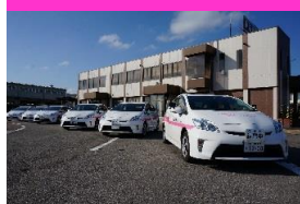
▲AT車は全車プリウス