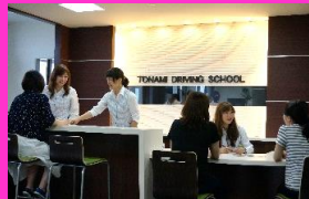
▲快適な待合ロビー&学科教室