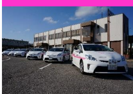
▲AT車は全車プリウス