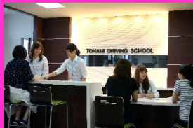
▲快適な待合ロビー&学科教室