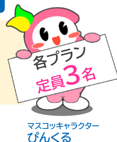
マスコットキャラクター ぴんくる