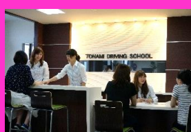
▲快適な待合ロビー&学科教室