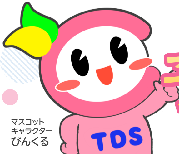
マスコット キャラクター ぴんくる